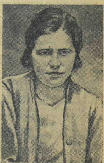
Организаторы и руководители подпольной комсомольской организации «Молодая гвардия», которым присвоено звание Героя Советского Союза (слева направо): Ульяна Громова, Иван Земнухов, Олег Кошевой, Сергей Тюленин, Любовь Шевцова.